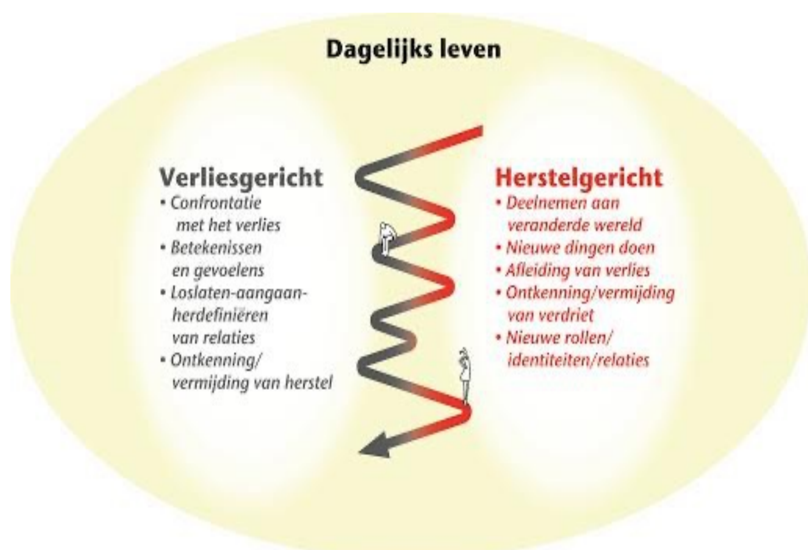
Duale Procesmodel van Omgaan met Verlies (Stroebe en Schut, 1999)

Het vertrekpunt is het duale procesmodel. Verlies is roeien met twee riemen. De twee riemen waarmee de persoon roeit, kenmerken elk een dimensie van het proces (zie afbeelding).